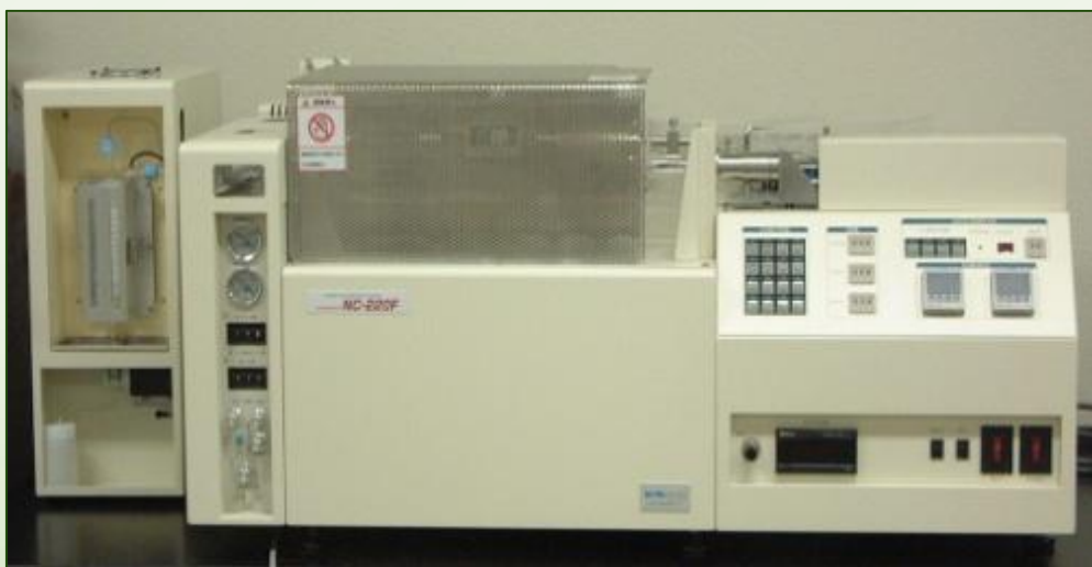
SUMIGRAPH NC-220F (株式会社住化分析センター)