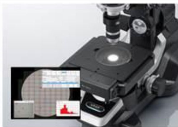
異物を自動でカウント コンタミカウンター