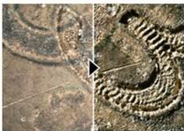
今までにない、見え方と立体感 マルチライティング