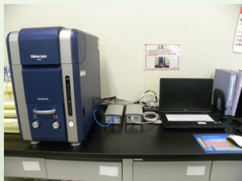
TM3030 (日立ハイテクノロジー)