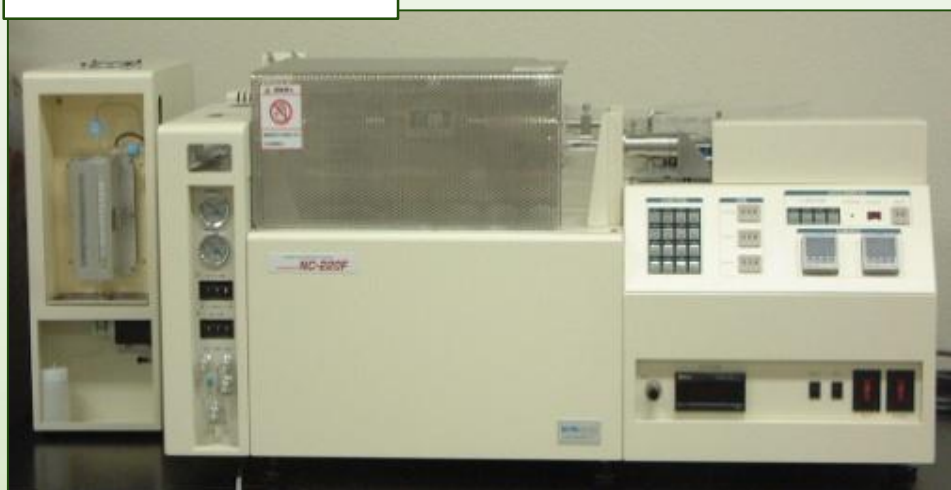
SUMIGRAPH NC-220F (株式会社住化分析センター)